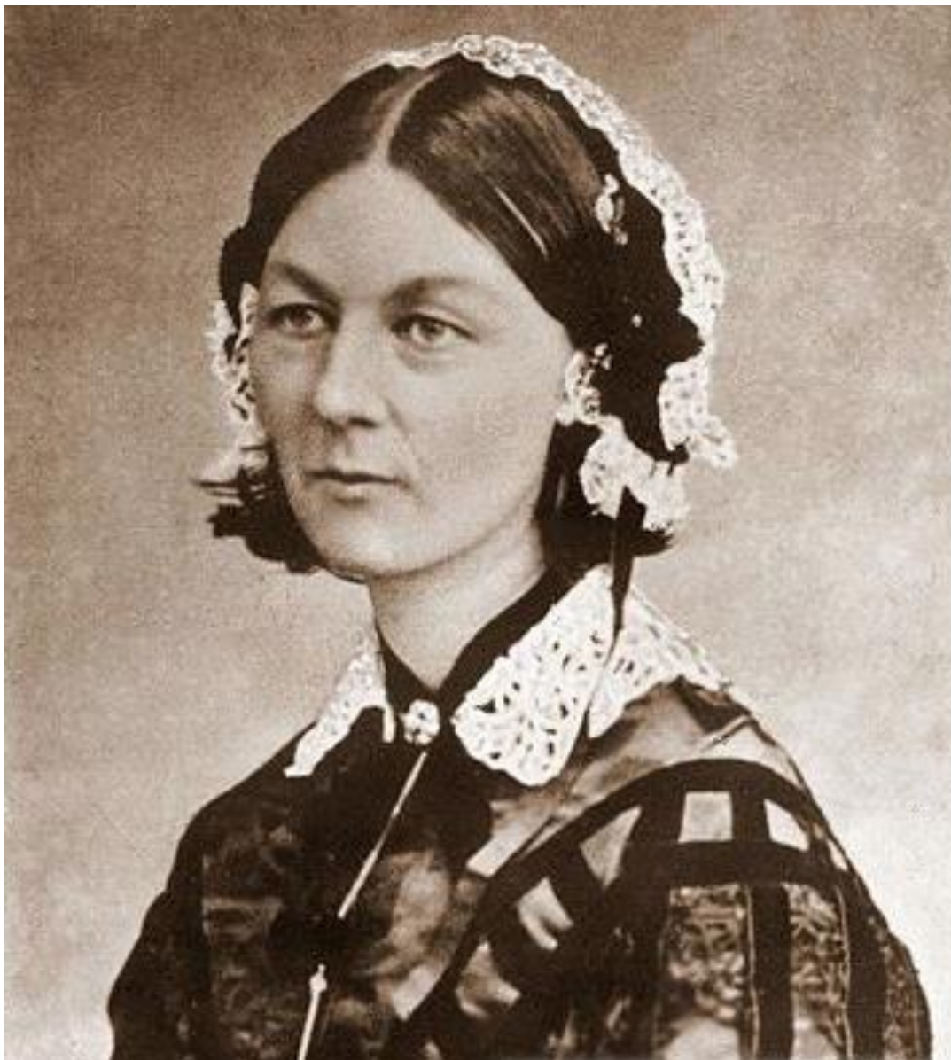
Флоренс Найтингейл, английская аристократка, первая сестра милосердия.