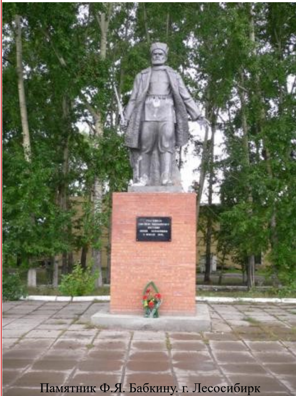
Памятник Ф.Я. Бабкину. г. Лесосибирск

бы- давления восстания в Енисейске в феврале 1919 г. маклаковский отряд пробился к тасеевским партизанам.