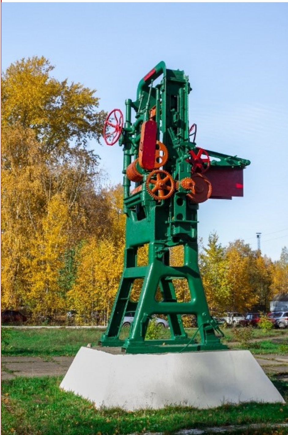
Первая лесопильная рама «Кархула»

Более ста лет назад в поселке Маклаково было образовано первое на территории Красноярского края лесопильное предприятие. То есть исторически так сложилось, что становление лесопиления края начиналась с Лесосибирска и именно в нашем городе были заложены основные традиции индустрии. И сейчас в отрасли работают профессионалы и мастера высокого уровня, закладываются новые традиции, развивается и семейный бизнес.