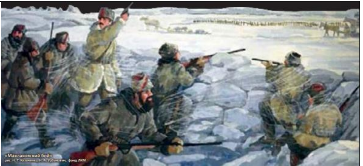
«Маклаковский бой» рис. Н. Т. Калачинко, Н. А. Урбанович, фонд ЛКМ