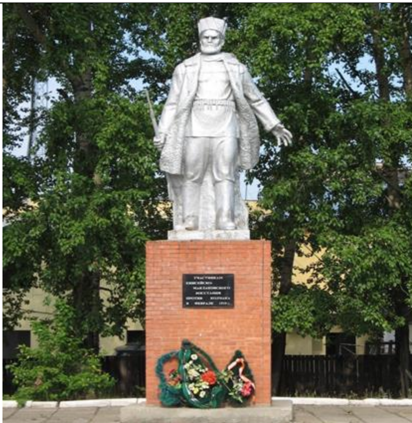
Скульптура человека с ружьем