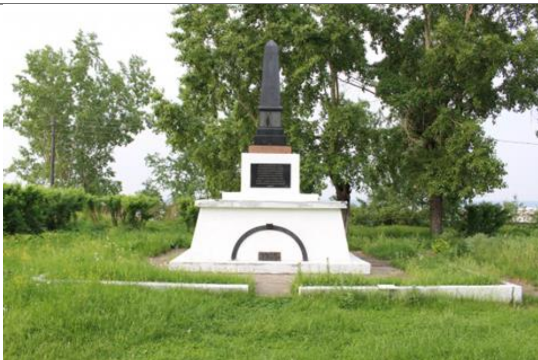
Братская могила 242 участников Енисейско-Маклаковского восстания